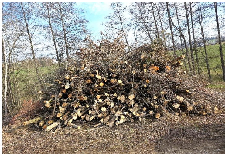
Im Bild Los 2 bei Enzersdorf.