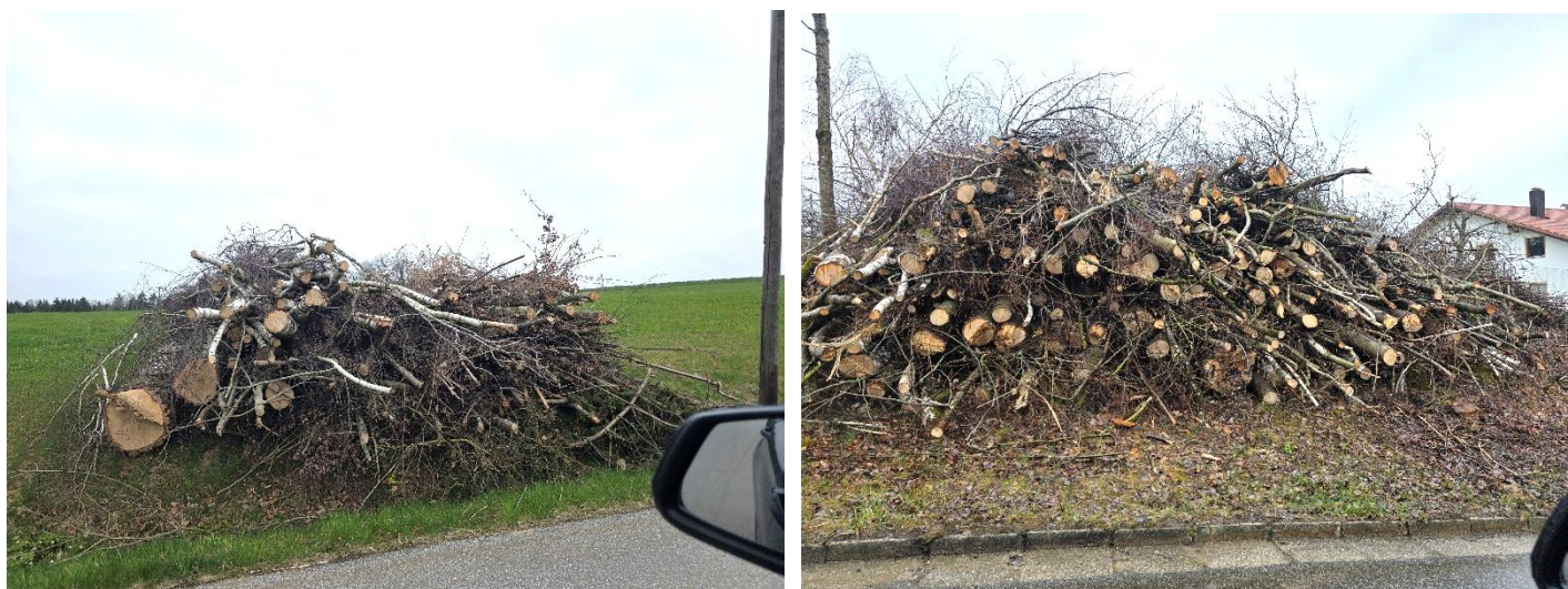
Im Bild Los 3 bei Wolfersdorf.