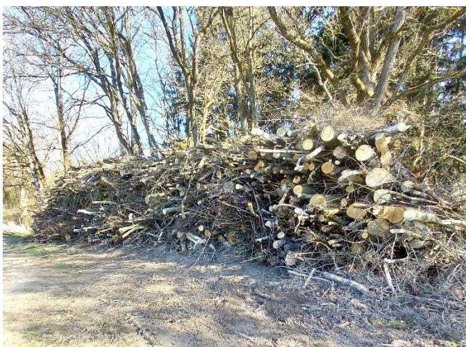
Im Bild Los 1 bei der Kläranlage.

Angebote sind schriftlich unter verschlossenem Umschlag mit der Aufschrift "Hackgut Witzmannsberg Los Nr. ..." bis Mittwoch, 13.05.2026, 11.00 Uhr , an die Gemeinde Witzmannsberg Marktplatz 10, 94104 Tittling, zu richten.